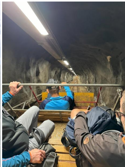
Eindrücke vom Betriebsausflug in die Göschenalp